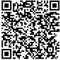
QR Code แบบฟอร์ม

ผู้มีคุณสมบัติที่จะเสนอขอพระราชทานฯ ต้องแบบรับรองคุณสมบัติของตนเอง ตามแบบฟอร์ม คส. ๒ เพื่อประกอบการเสนอขอพระราชทานฯ